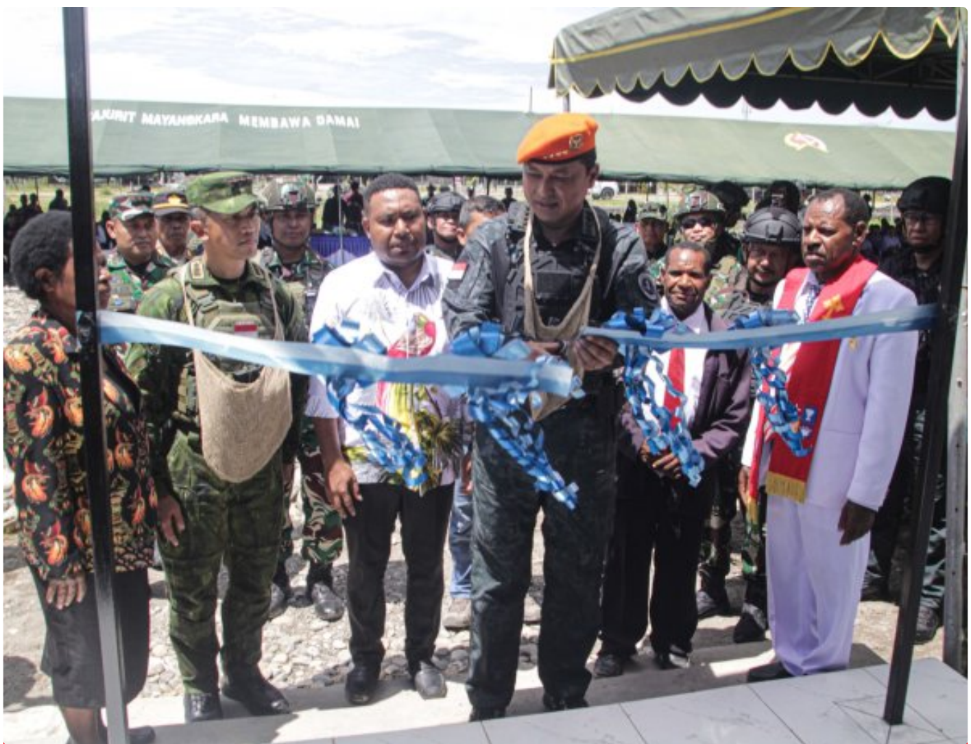
Foto: Kepala Staf Angkatan Udara (Kasau), Marsekal TNI Mohamad Tonny Harjono, S.E., M.M., meresmikan Gereja GPCI Mayangkara pada Rabu (12/02/2025).