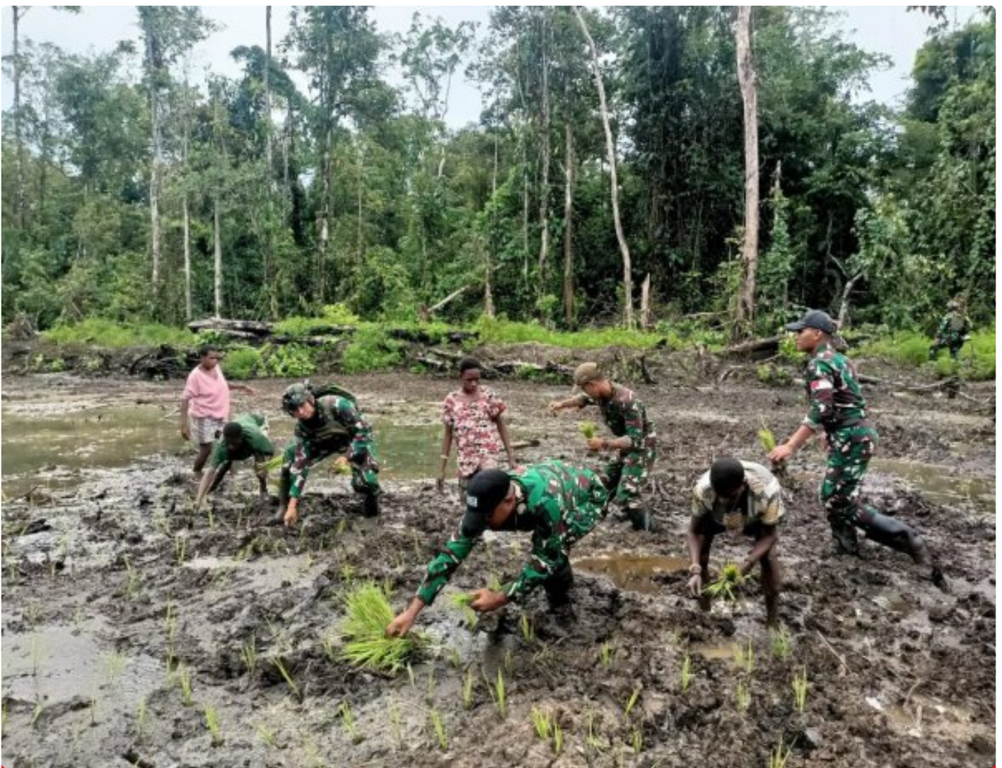
Foto: Satgas Pamtas Mobile RI-PNG Yonif 503/Mayangkara menggagas program ketahanan pangan yang melibatkan langsung warga Kampung Mumugu, Distrik Krepkuri, Kabupaten Nduga, Selasa (07/01/2025).